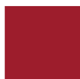
R036 Rouge Cerise