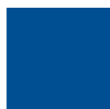
859 Bleu Majorelle