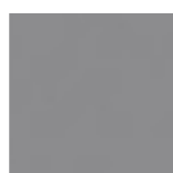
G075 Gris Cendré