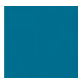
B124 Bleu Batik